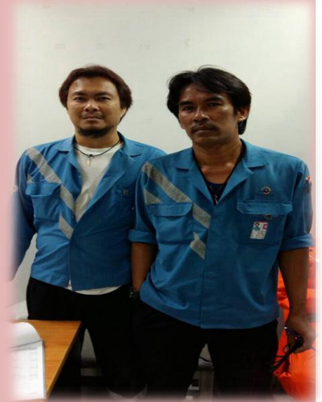
02026 ทวีศรีโรสง(ชาย)